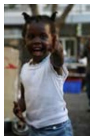
5D0137 37x56 cm také/also 47x70 cm, 53x80 cm

Pictures are printed by large format printer HP Designjet 130 on HP photopaper Premium Plus Photo Satin.