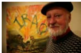
5D2246 56x37 cm 5 500,- Kč také/also 70x47 cm, 80x53 cm