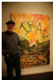
5D2254 37x56 cm 5 000,- Kč také/also 47x70 cm, 53x80 cm