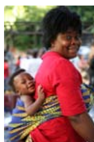
5D0194 37x56 cm také/also 47x70 cm, 53x80 cm