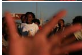
5D1400 56x37 cm také/also 70x47 cm, 80x53 cm