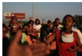
5D1396 56x37 cm také/also 70x47 cm, 80x53 cm

On the way to the airport I wanted to make a few pictures of absurdities from Cape Town outskirts. Suddenly between zooming cars appears running training group of slum kids followed by solitary runner and scenery was closing homeless with his day closing "run".