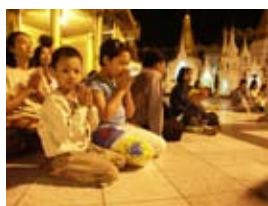
7D0119 56x42 cm také/also 73x53 cm, 80x60 cm

Obrazy jsou tištěny velkoplošnou tiskárnou HP Designjet 130 na HP fotopapír Premium Plus Photo Satin.