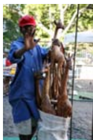
5D0120 37x56 cm také/also 47x70 cm, 53x80 cm