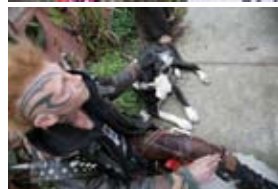
5D2363 56x37 cm také/also 70x47 cm, 80x53 cm