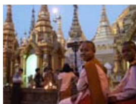
7D0062 56x42 cm také/also 70x53 cm, 80x60 cm